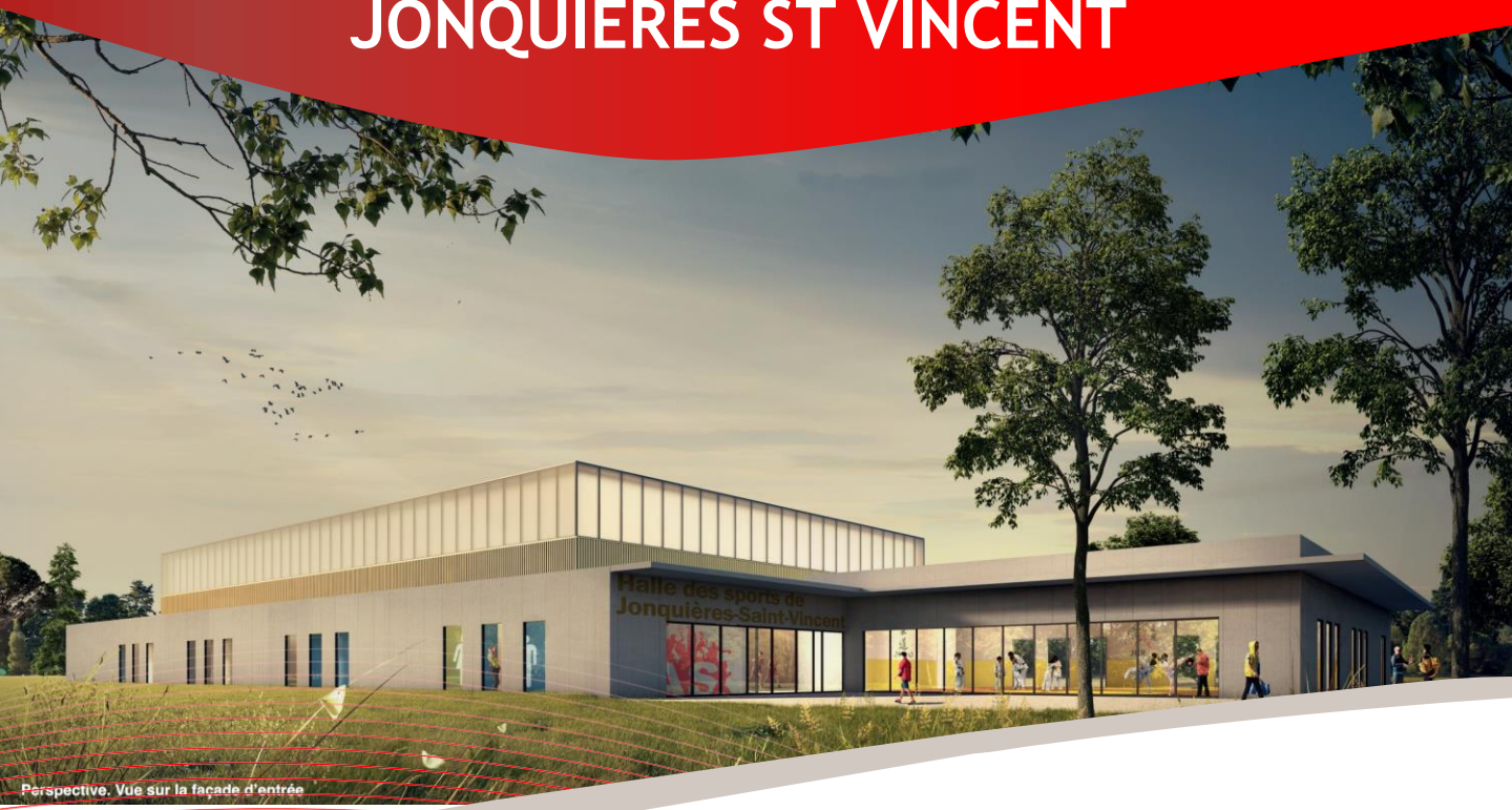
Perspective. Vue sur la façade d'entrée